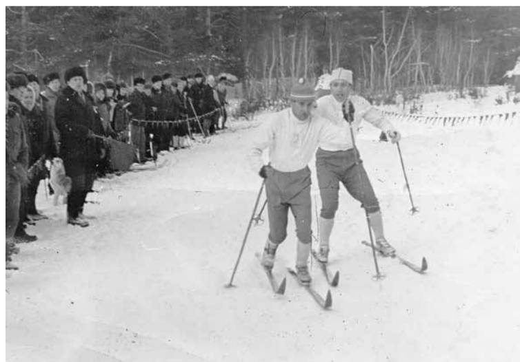
Соревнования по лыжным гонкам. г. Артемовский