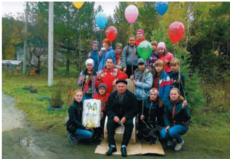
С воспитанниками на 70-летию