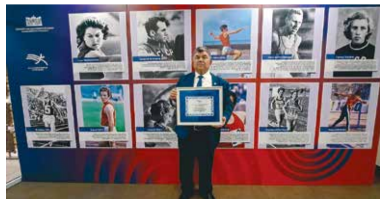
В Государственной Думе