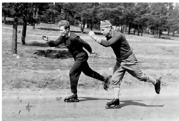
Конференция тренеров. Динамо, 1963 г.

— Какими еще значимыми для вас наградами отмечен ваш трудовой и спортивный путь?