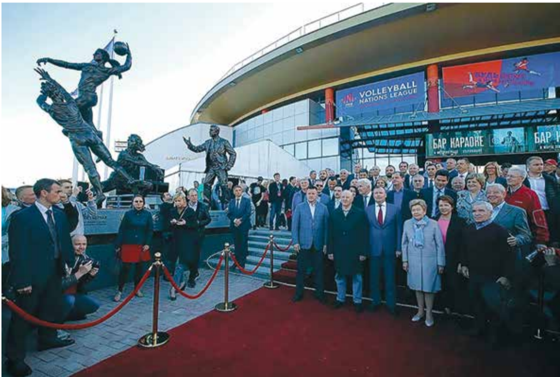
В Екатеринбурге перед Дворцом игровых видов спорта «Уралочка» открыт памятник волейбольному тренеру Николаю КАРПОЛЮ

был первый разряд. По шахматам — второй разряд. По русским шашкам выполнил кандидатский минимум... В общем, я здорово полюбил спорт. Мне советовали поступать в институт физкультуры в Ленинграде. Но мама