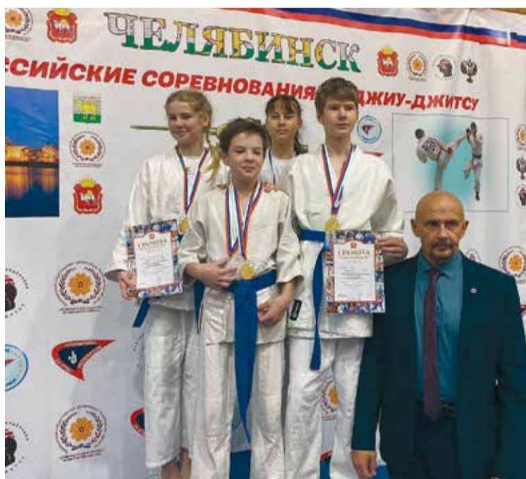
Всероссийские соревнования «Слава танкограда», Челябинск, 2023 г.