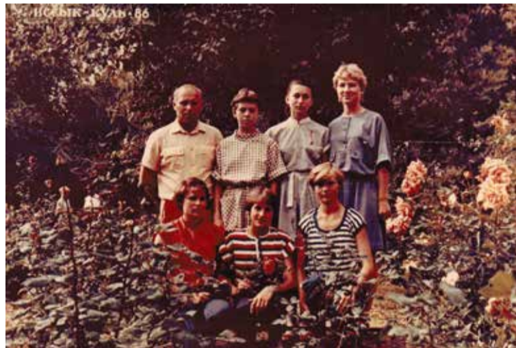
Учебно-тренировочные сборы. Сборная области по биатлону — девушки. Иссык-Куль, 1986 г.

— Но тут, конечно, большая заслуга и тренера Миха-