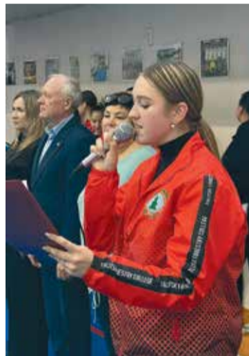
Открытие основного отборочного этапа чемпионата АССК по игровым видам спорта, 24 октября 2023

— С 30 октября 2023 года в ССК «Триумф-ТЛК» вновь стартовал основной отборочный этап чемпионата АССК России по игровым видам спорта. Заявки на участие в волейболе подали 16 юношеских команд и 10 женских команд. Соревноваться по волейболу студенческие команды будут до 19 де-