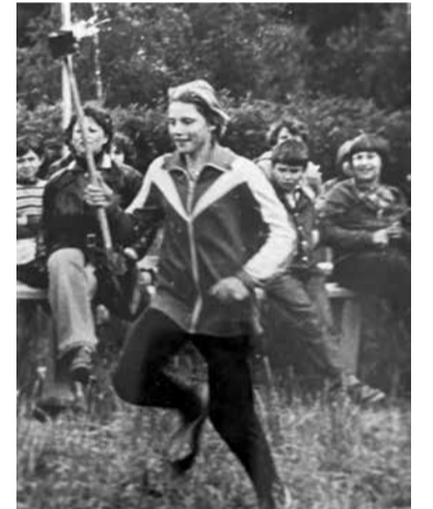
В пионерском лагере, 1980 г.