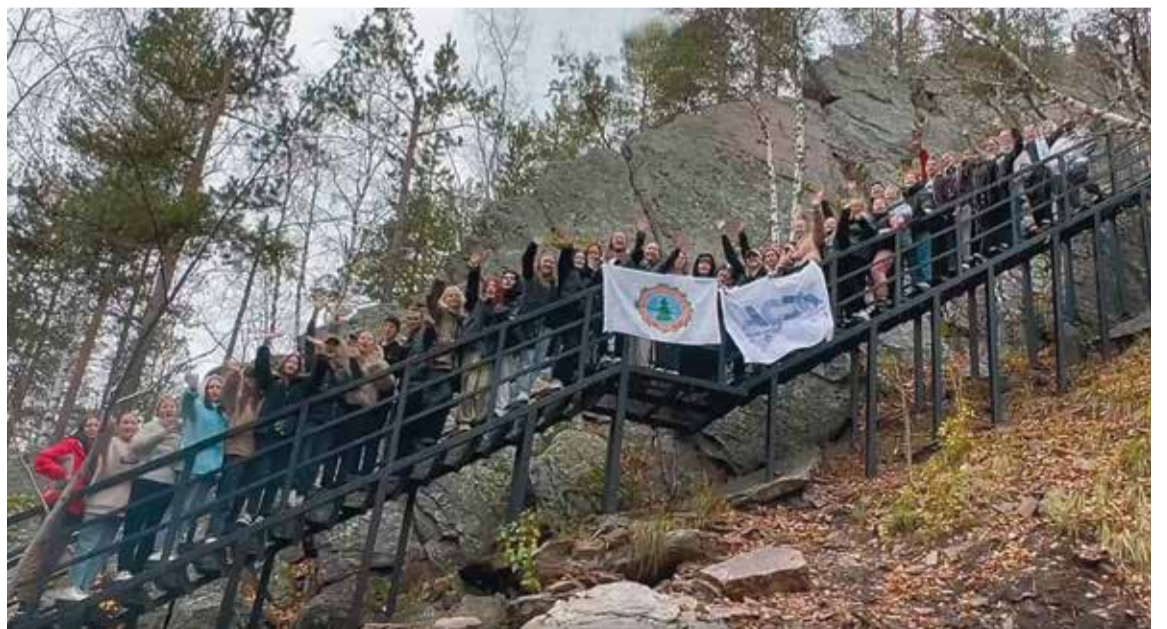
Активисты и спортсмены ССК Триумф-ТЛК в нацпарке Таганай, г. Златоуст, октябрь 2023

кабря 2023 года, а с 20 декабря стартует основной отборочный этап чемпионата АССК по футболу 5x5. Надеемся, что нашим спортсменам удастся выиграть путёвку на суперфинал чемпионата АССК. В рамках чемпионата пройдёт также Кубок бо-