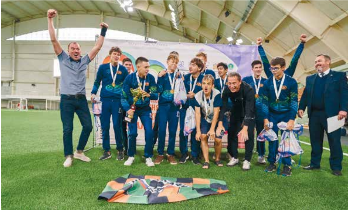
Сборная Свердловской области во время награждения. Радость сдержать сложно

Лёгкая атлетика, плавание, спортивное ориентирование — о том, как выступили свердловчане на IV Всероссийской летней спартакиаде инвалидов, мы говорили в прошлом номере «Спорт-Аншлага». Настолько были впечатлены успехами земляков, что забыли написать о наших футболистах. Непростительно! Они выступили также выше всяких похвал. Уральцы в родных стенах — этот этап соревнований проходил в Екатеринбурге — выиграли все четыре матча, обыграв Москву и Петербург. Пообщались с тренерами САШ ПСР, подготовившими большую часть сборной. Исправляемся и публикуем неожиданно возникшее продолжение статьи.