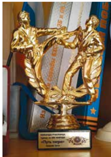
Кубок команды призеров открытых соревнований по ВБЕ Кобудо, Нижний Тагил, 2023 г.