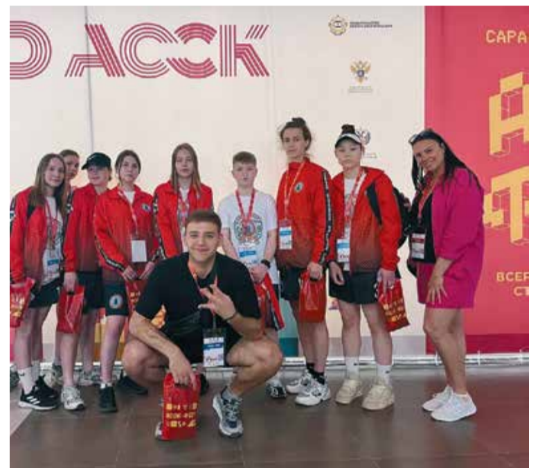
Команда футболисток — 2 место в суперфинале чемпионата АССК России, г. Саранск, май 2023

которые активно занимаются спортом, более общительны, коммуникабельны, энергичны, справедливы и ответственны. Кроме того, у них более развиты лидерские качества. Такие юноши и девушки активнее проявляют себя в процессе обучения, к тому же они, как правило, стрессоустойчивы и уверены в себе. Но главное, что они обладают более крепким здоровьем.