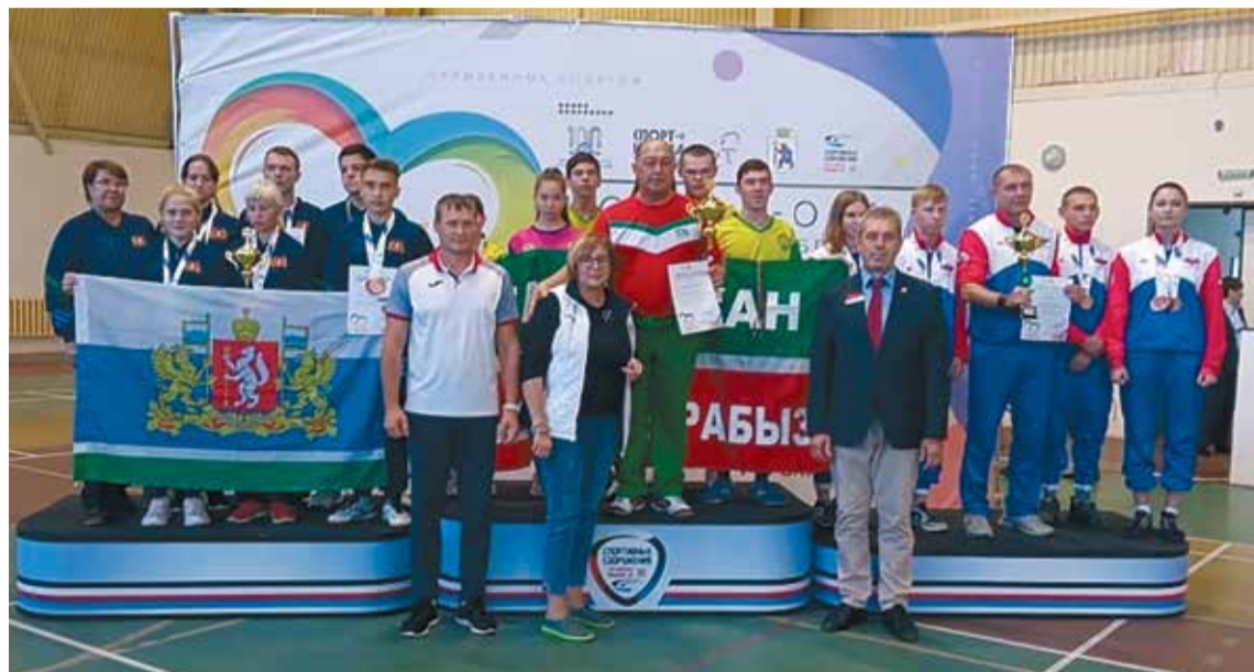
IV Всероссийская летняя Спартакиада инвалидов по настольному теннису (спорт ЛИН). Награждение