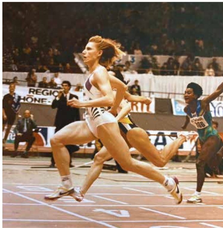
Европа, 1995 г. Финиш на 60 м.

— Вы — уникальная звезда. Вам удавалось возвращаться в спорт после травм, которые ставят крест на спортивной карьере. В частности, говорю о порыве