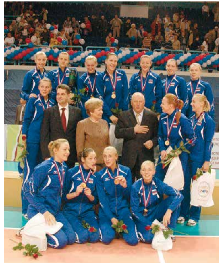
Кубок Ельцина по волейболу

«два шага — два толчка». И в заключение идешь вообще без палок. Между этими километрами — пара минут, чтобы отдышаться. В общем, по лыжам на всех дистанциях я имел первый разряд. А в 1956 году в Сыктывкаре я получил мастера спорта на дистанции 100 км. Ту гонку я прошел за шесть часов, причем, выиграл у чемпиона мира! Так получилось, что я стартовал в 20 секундах позади него. На втором километре догнал. Бежал за ним километром десять. Чувствую себя легко. Решил обойти и сразу оторваться, чтобы он не мог за мной зацепиться. И мне это удалось! Накатал ему, по-моему, десять минут... Но не только тренировки, но и сама жизнь заставляла меня быть физически сильным. Между Герд-Иолем и интернатом в Водном, где я учился, было 12 км. У меня был деревянный чемоданчик, куда на неделю мама мне складывала продукты: пару килограммов картошки и пол-литра рыбьего жира. Картошку с ребятами съедали быстрее, чем заканчивалась