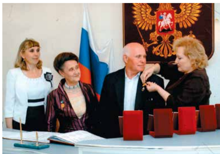
С супругой на вручении медалей за 55-летие совместной жизни

— Как так получилось, что после армии оказались в Артемовском? Могли же осесть и в том же Бобруйске, где была ваша летная часть.