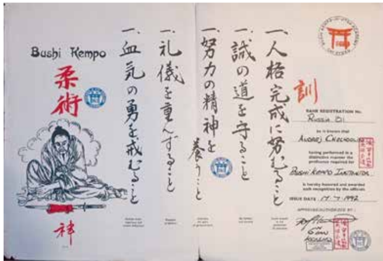
Из всех дипломов очень ценю этот. Первый в России

сили на чемпионат России, а еще двое ребят из младшей группы стали чемпионами. В октябре на прошедших в Челябинске Всероссийских соревнованиях по джиу-джитсу «Слава Танкограда», в которых участвовали более 500 спортсменов, мои подопечные взяли шесть золотых и