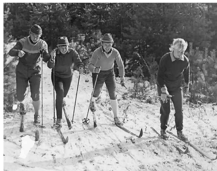
Уктус, 1964 г.