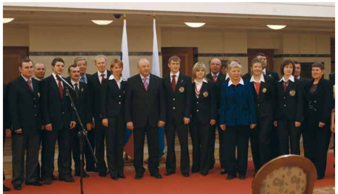
Олимпийцы 2006 года в Турине на приеме у губернатора

работал в Тагиле, ходил на Сулем на хариуса. Ехал до поселка Уралец, там оставлял машину. И через Белую напрямую по тайге шел 15 км по лесу на реку. Поднимался на Белую и думал: «Если когда-нибудь в жизни я буду работать в такой должности, что от меня будет зависеть решение о строительстве комплекса, то я обязательно здесь его сделаю». Судьба так сложилась, что я стал губернатором. Я сразу занялся реализацией проекта. Конкурс на проектные работы выиграла канадская фирма. Ее представители изучили все горы и сказали, что Белая — самая лучшая гора на Урале. Здесь можно проводить даже ряд олимпийских дисциплин. Можно сделать больше 30 спусков длиной от 900 метров до 3 километров. Самую длинную я