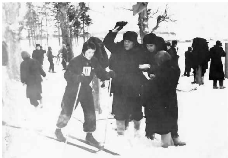
Первый в жизни старт. Ирбит, декабрь 1951 г.

призывников-спортсменов, которую 25 октября со сборного пункта на Химмаше отправили в Пермь (тогда это был Молотов). Я в механизированном корпусе УралВО в Перми прошел полный курс молодого бойца, да еще и в школе сержантов отучился. Мне распоряжением командира части разрешили вставать за полчаса до общего подъема на зарядку по индивидуальному плану. Несколько раз отпускали в увольнение на лыжную трассу в сопровождении старослужащего сержанта, так как я еще не принял присягу. Плюс, в ноябре мы ходили пешком за 9 километров от Перми в лес, где расчищали территорию под стрельбище, что было для меня дополнительной тренировкой. А 14 декабря на первенстве корпуса я выиграл лыжную гонку на 5 километров. А летом 1958 года, успешно сдав вступительные экзамены, я был принят на учебу в Ленинградский институт физкультуры имени Лесгафта, и меня досрочно уволили в запас — тогда служили три года, а я отслужил два с половиной.